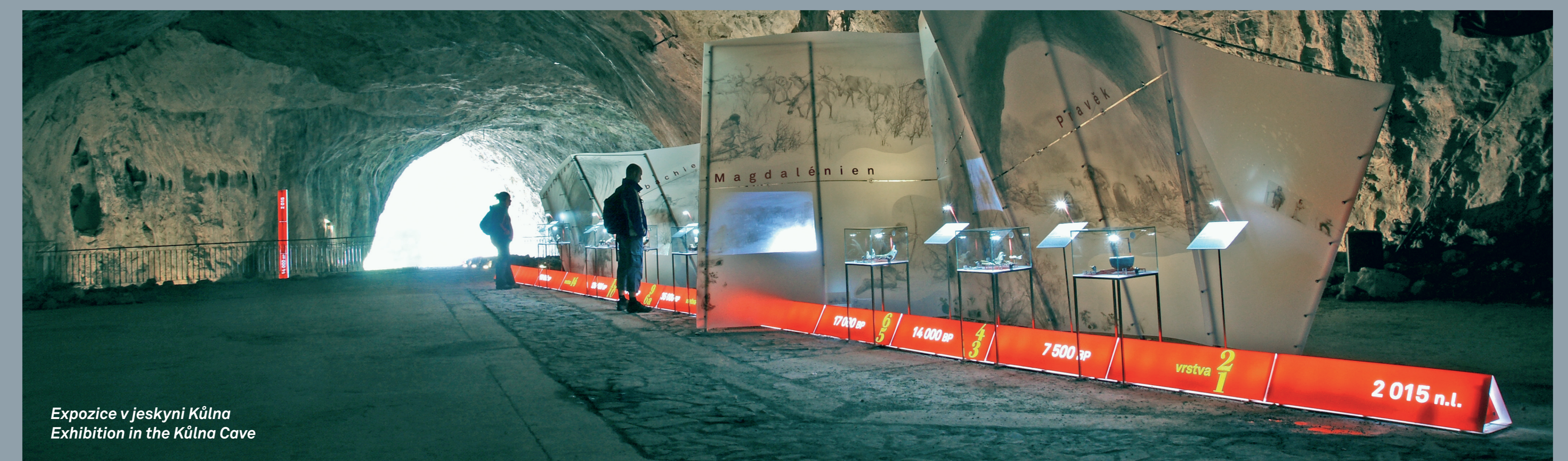
Expozice v jeskyni Kůlna Exhibition in the Kůlna Cave

This cave network in the Sloup brook disappearance area is the longest show cave in the Czech Republic, and has a rich history. The visitors' tour ends up in the great Kůlna Cave portal. KŮLNA CAVE, which is a part of the Sloup-Šošůvka caves, features a collection of illustrations, copies of original finds, video sequences, dioramas and archaeological profiles from this archaeological site of European importance.