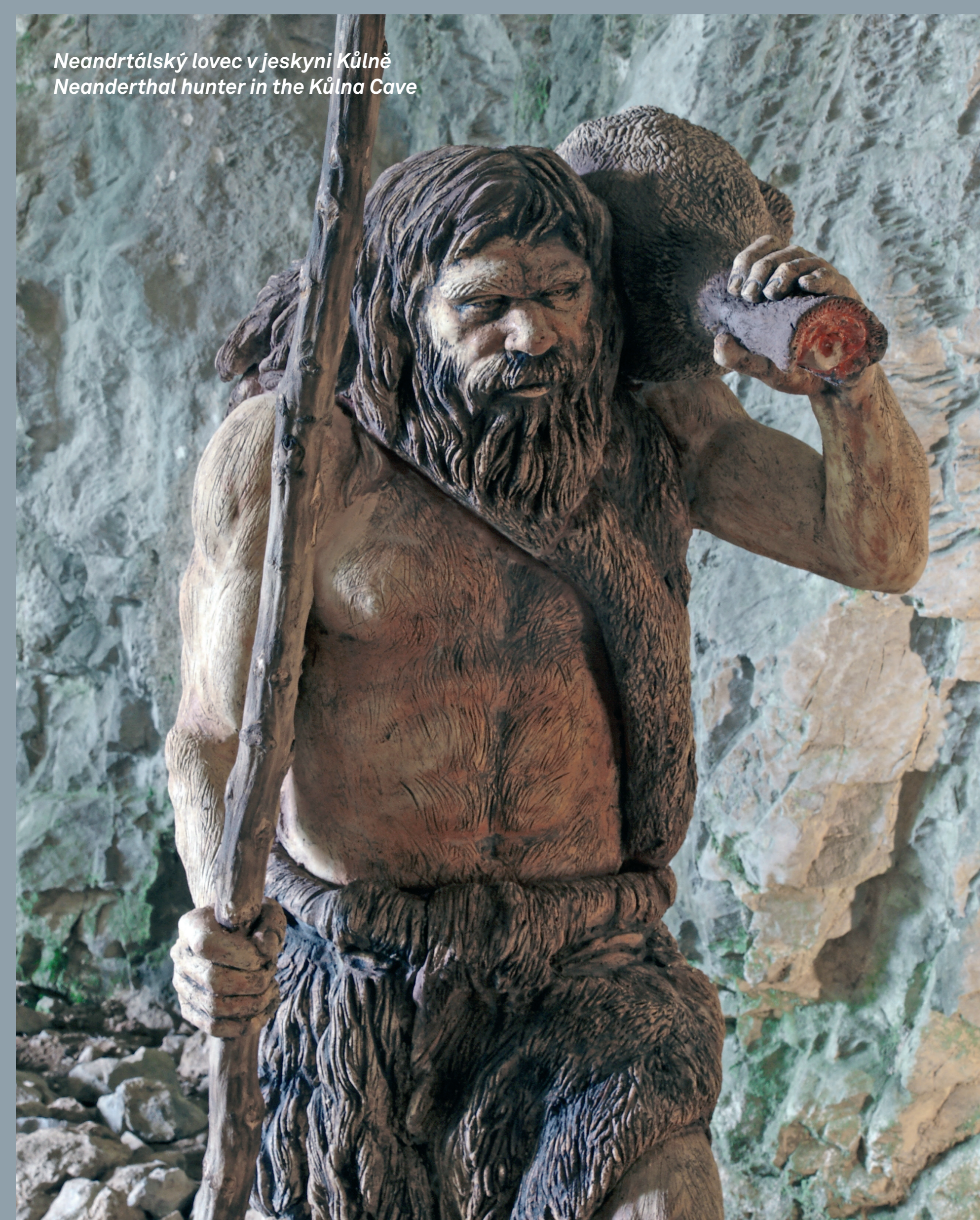
Neandrtálský lovec v jeskyni Kůlně Neanderthal hunter in the Kůlna Cave