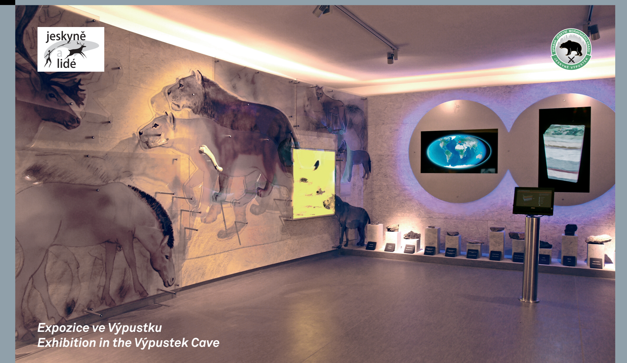
Expozice ve Výpustku Exhibition in the Výpustek Cave

Enter the secret military structures in the cave! Do you know how the time machine works? Touch prehistory in the first speleological exhibition entitled CAVES AND PEOPLE! ALL OF THESE THINGS AWAIT YOU IN THE VÝPUSTEK CAVE!