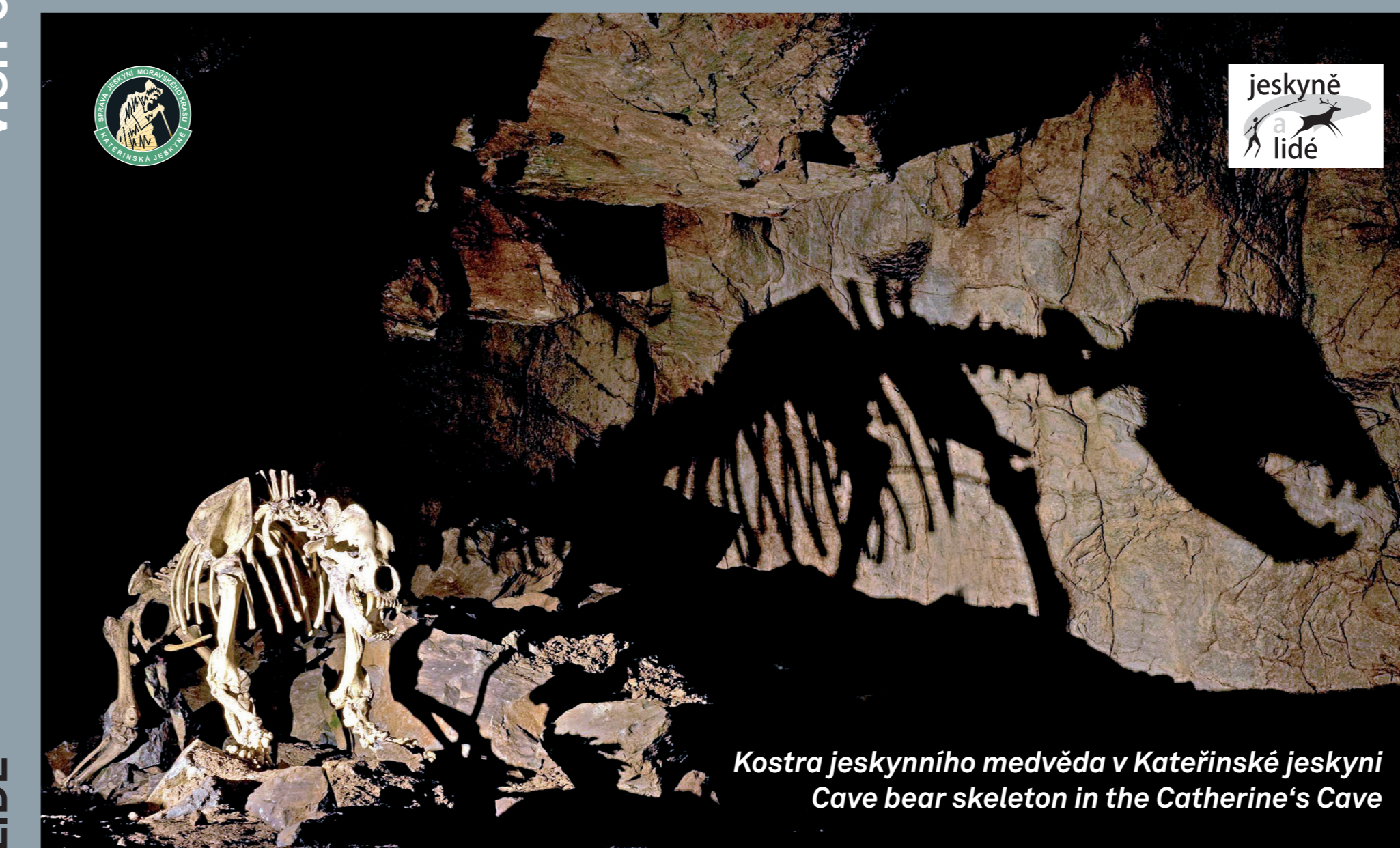
Kostra jeskynního medvěda v Kateřinské jeskyni Cave bear skeleton in the Catherine's Cave