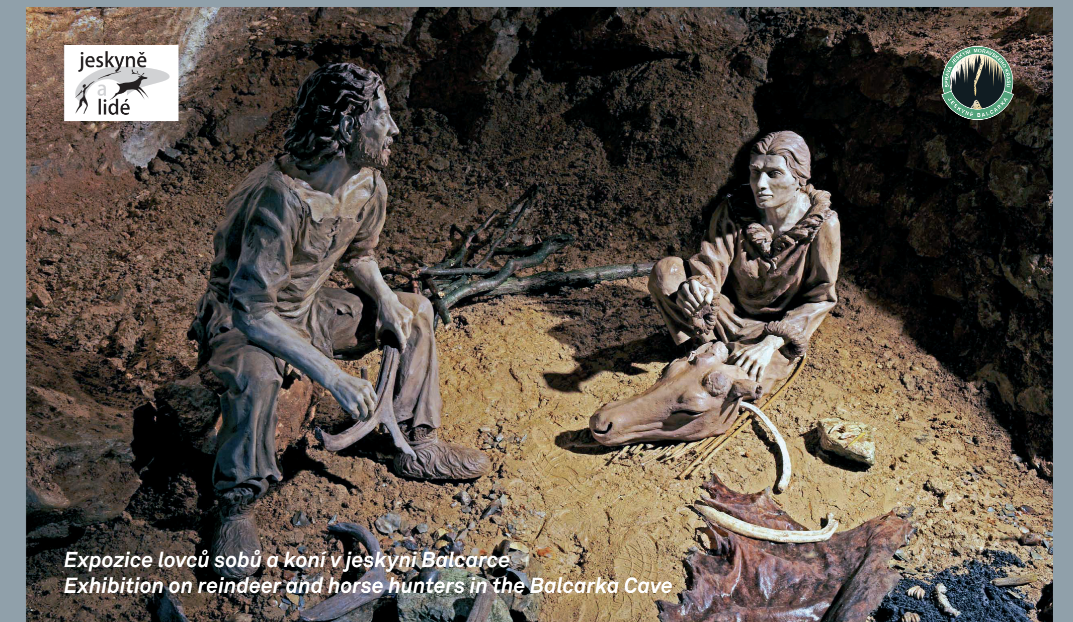
Expozice lovů sobů a koní v jeskyni Balcarka Exhibition on reindeer and horse hunters in the Balcarka Cave

Join the prehistoric hunters on the trail of reindeer! Do you know what our ancestors left in the caves thousands of years ago? Do you think you know who lived among dripstones in prehistoric times? LISTEN AND LOOK CAREFULLY IN THE BALCARKA CAVE!