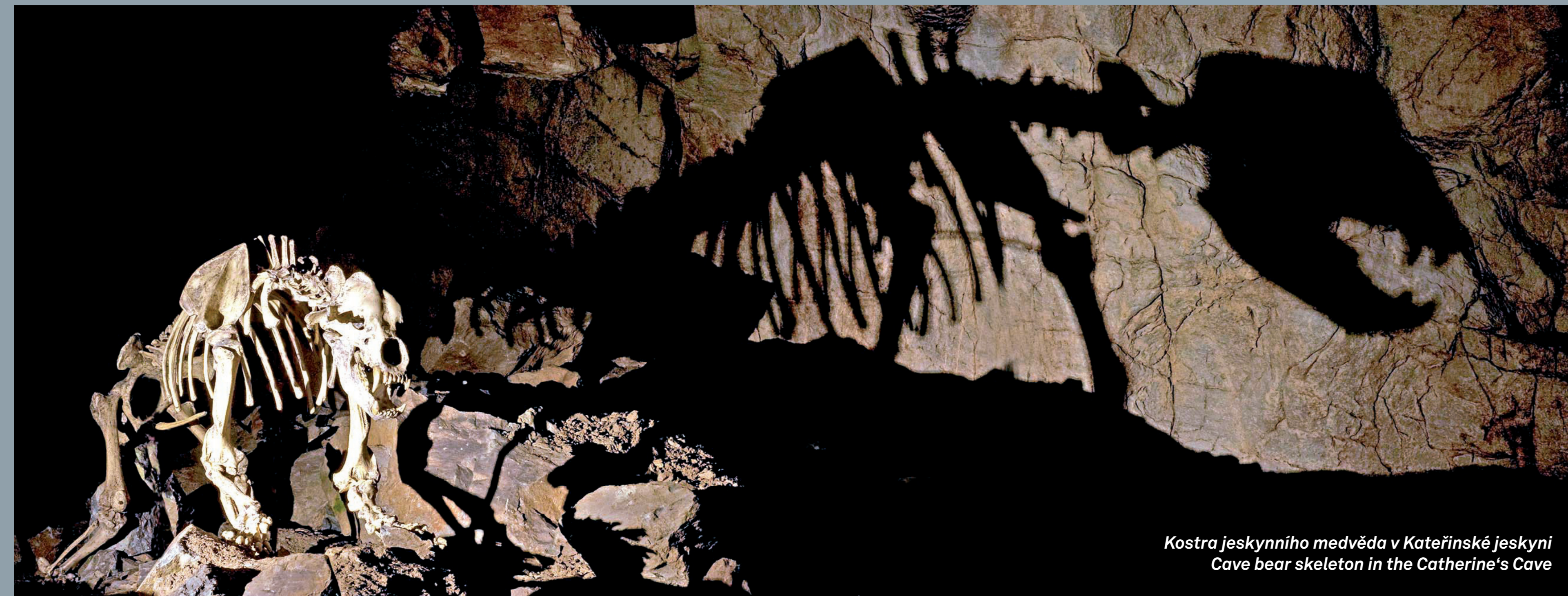
Kostra jeskynního medvěda v Kateřinské jeskyni Cave bear skeleton in the Catherine's Cave