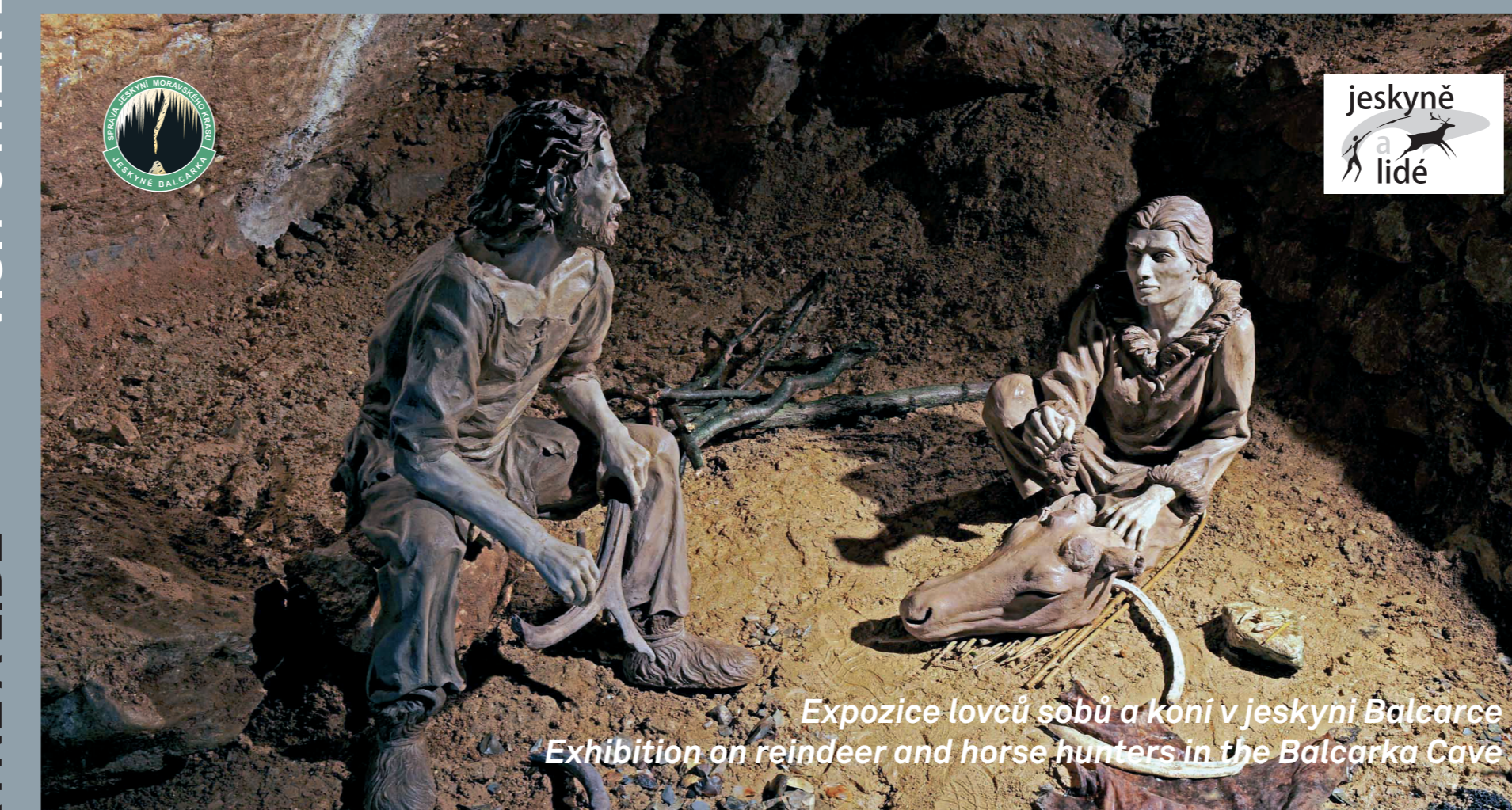
Expozice lovu sobů a koní v jeskyni Balcarka Exhibition on reindeer and horse hunters in the Balcarka Cave