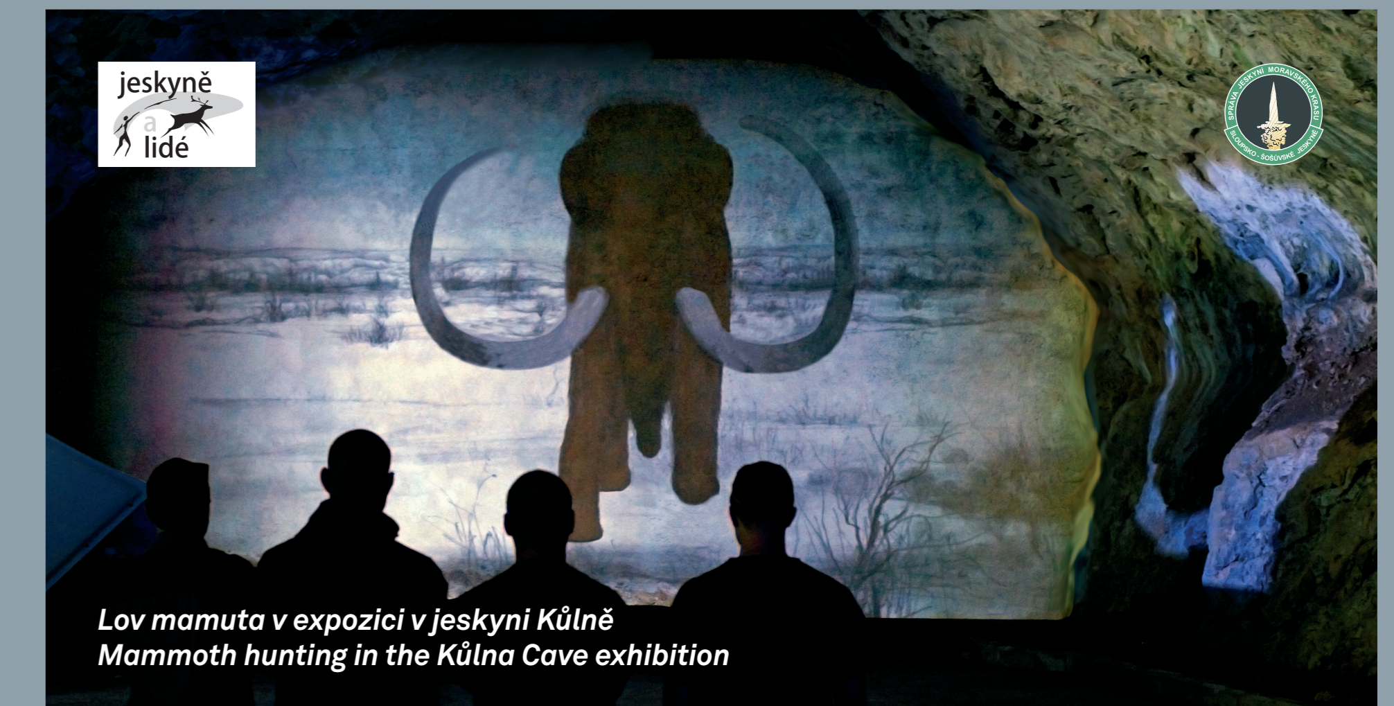
Lov mamuta v expozici v jeskyni Kůlně Mammoth hunting in the Kůlna Cave exhibition

YOU WILL SEE AND EXPERIENCE ALL OF THESE THINGS IN SLOUP-ŠOŠŮVKA CAVES!