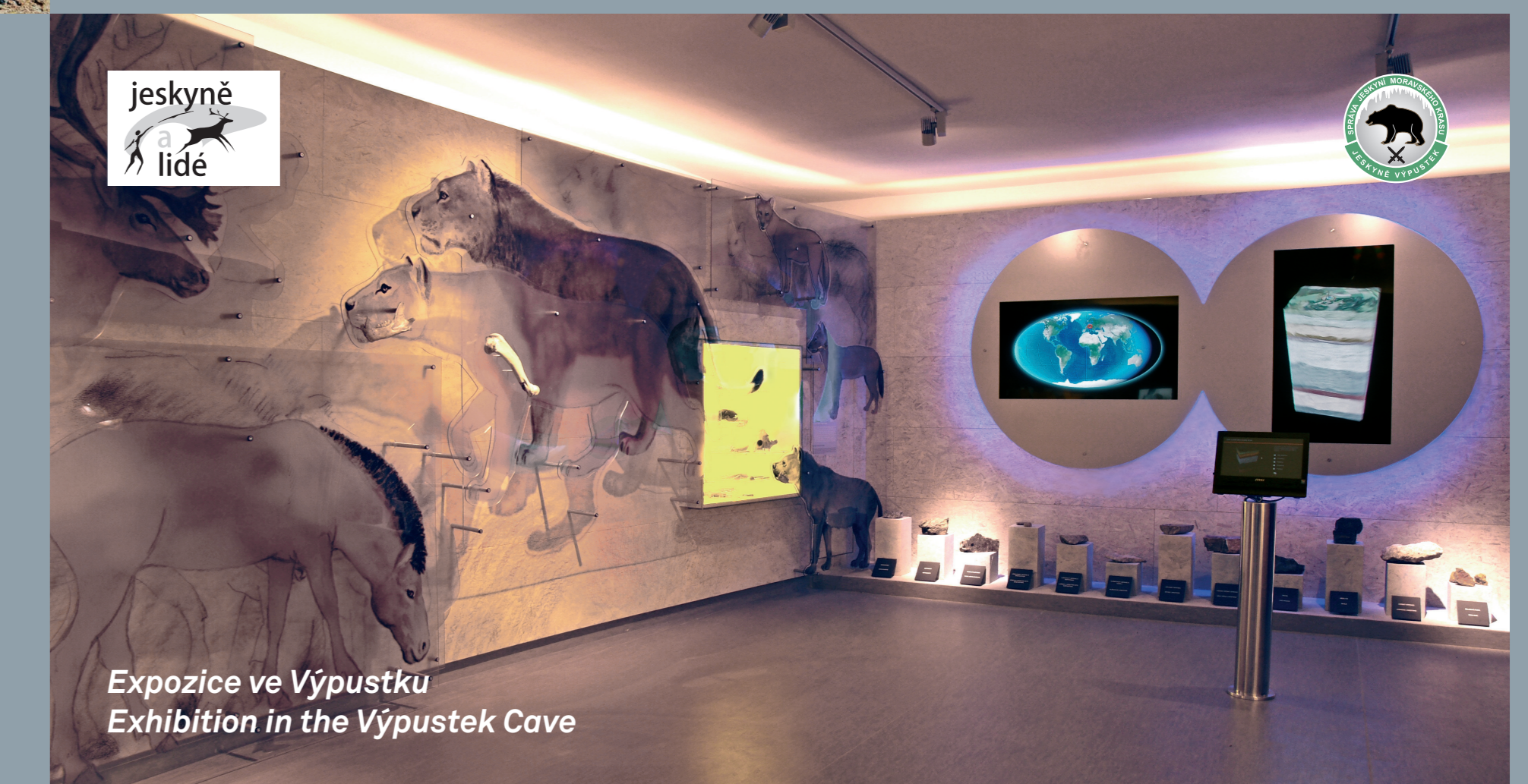
Expozice ve Výpustku Exhibition in the Výpustek Cave

ALL OF THESE THINGS AWAIT YOU IN THE VÝPUSTEK CAVE!