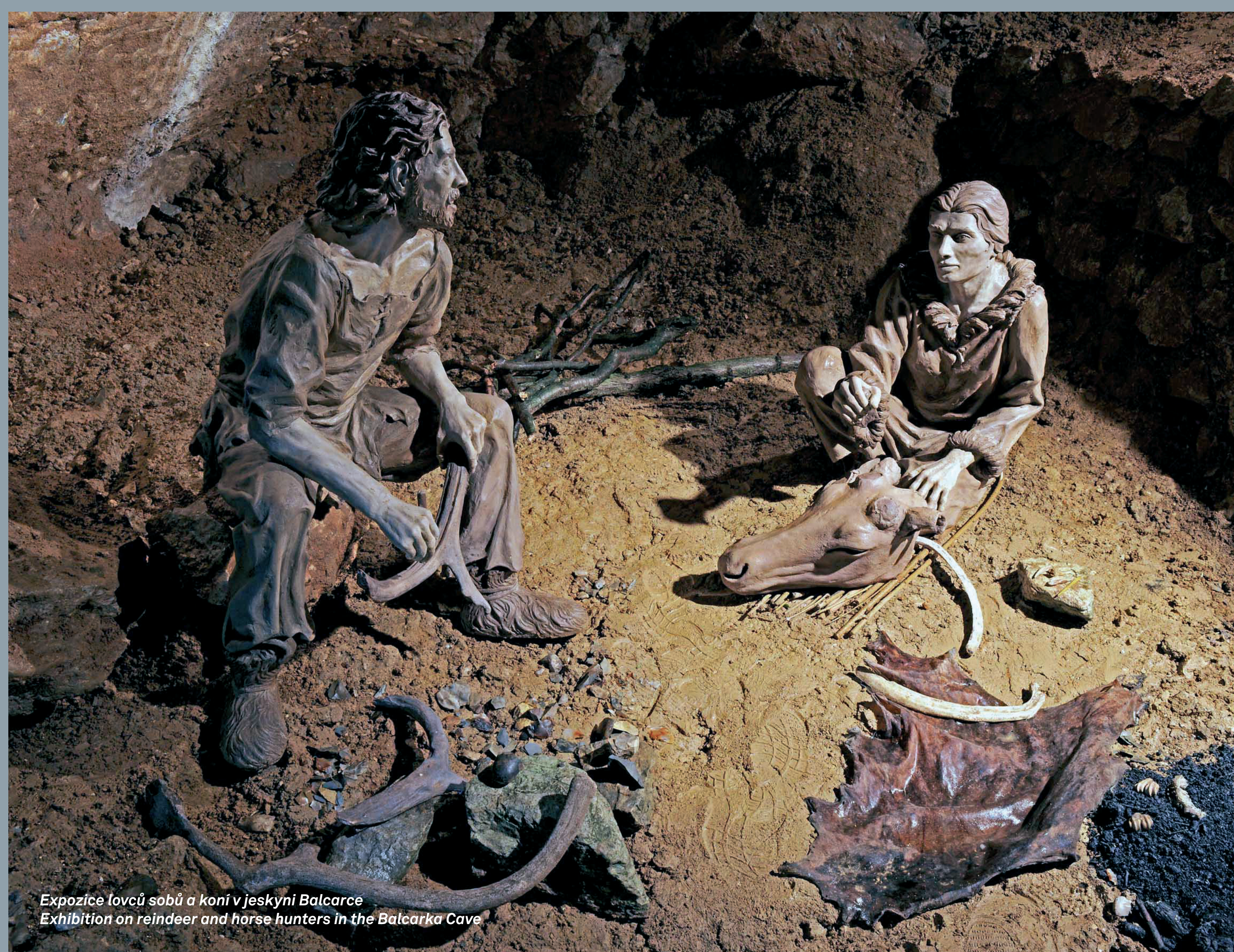
Expozice lovců sobů a koní v jeskyni Balcarka Exhibition on reindeer and horse hunters in the Balcarka Cave

It also describes the „maternity place“ of the cave bears.