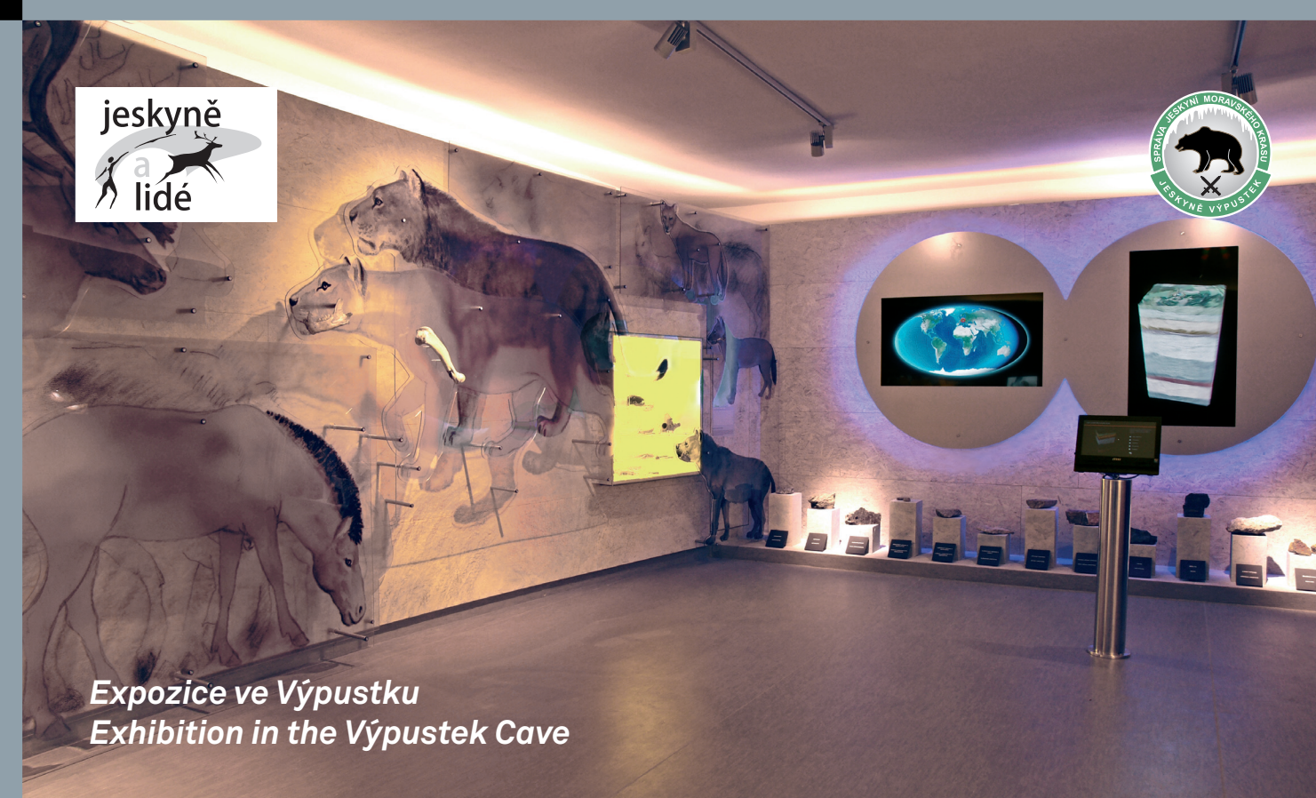
Expozice ve Výpustku Exhibition in the Výpustek Cave

ALL OF THESE THINGS AWAIT YOU IN THE VÝPUSTEK CAVE!