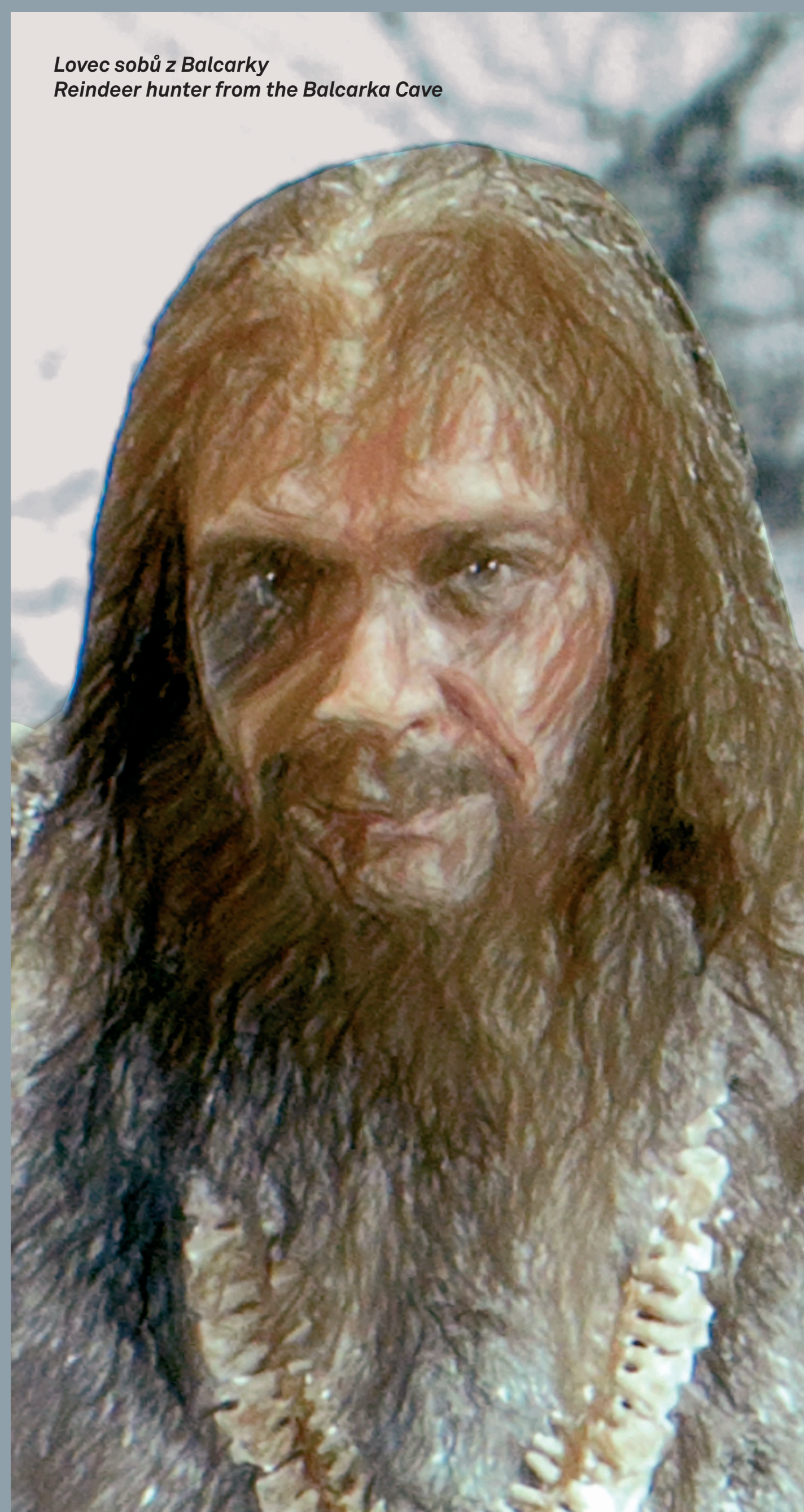
Lovec sobů z Balcarky Reindeer hunter from the Balcarka Cave