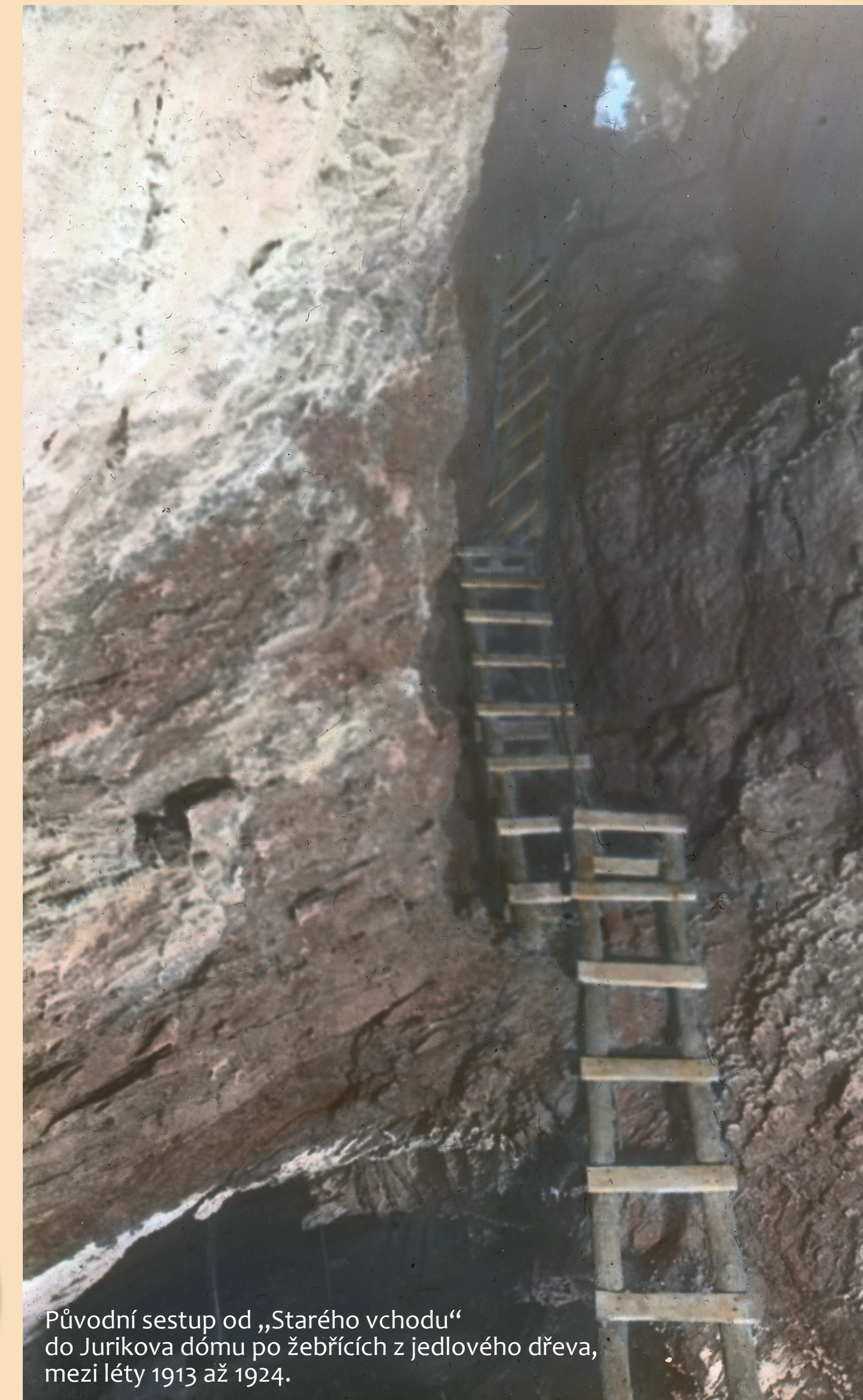
Původní sestup od „Starého vchodu“ do Juríkova dómu po zebřících z jedlového dřeva, mezi léty 1913 až 1924.