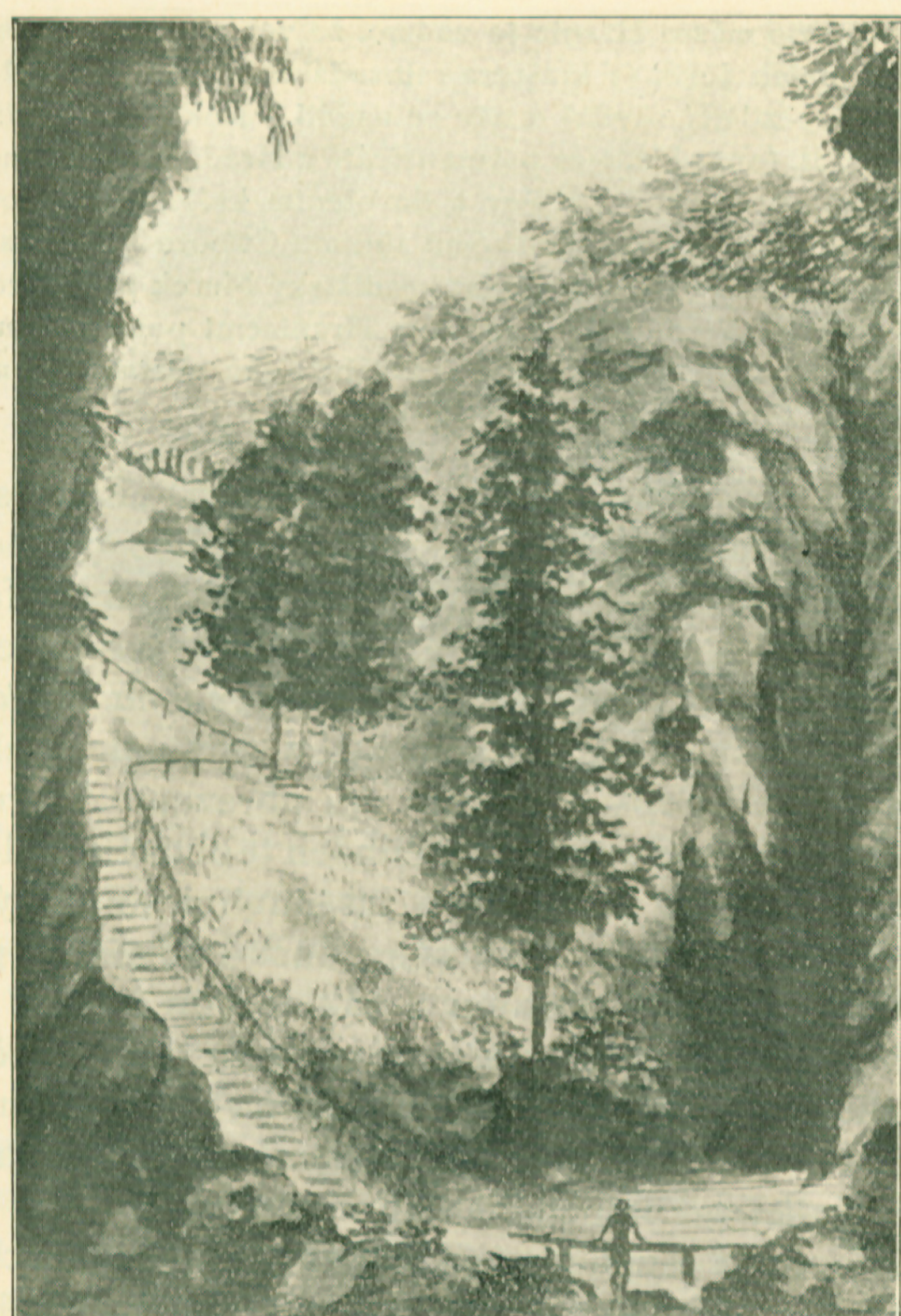
PROPAST DLE GALAŠE Z R. 1816

V ROCE 1813 NECHAL HRANICKÝ HEJTMAN KAREL HRABĚ CHOTEK ZŘÍDIT 260 DŘEVĚNÝCH SCHODŮ AŽ K JEZÍRKU. PODLE GALLAŠE BYLY VYBUDOVÁNY ZE STROMŮ SKÁCENÝCH V PROPASTI. NEDLOUHO POTÉ JE ZACHYTL RYTEC ADOLF KUNIKE (CCA 1825).