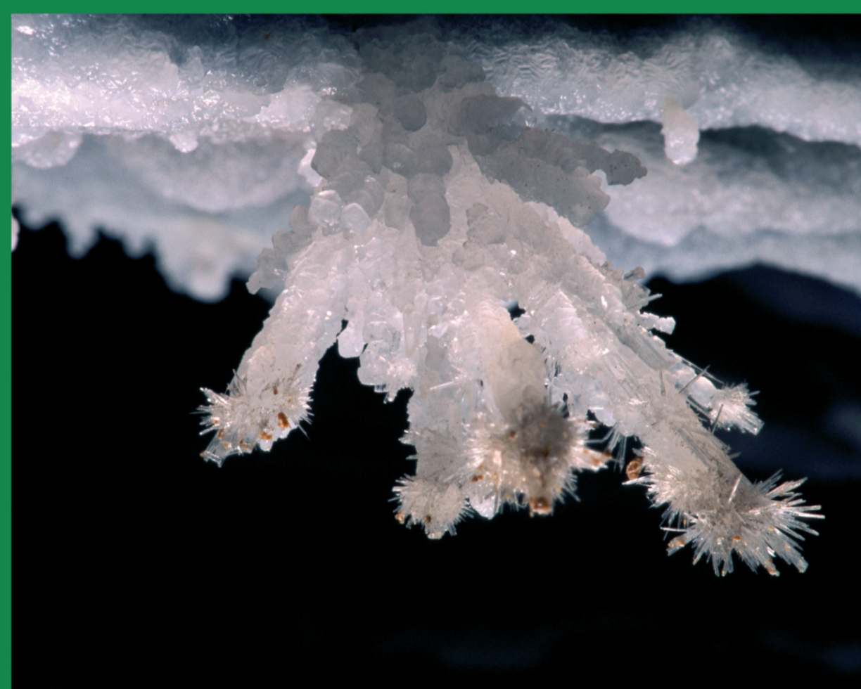
Detail vzácných krystalů minerálu aragonitu