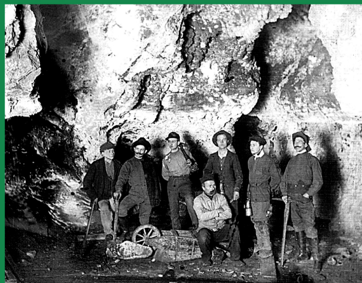
Objevitelé Zbrašovských jeskyní v Koblihové síni asi kolem roku 1915 Zákoutí Tunel s raftovými stalagmity (vlevo) a hladinou kyselky