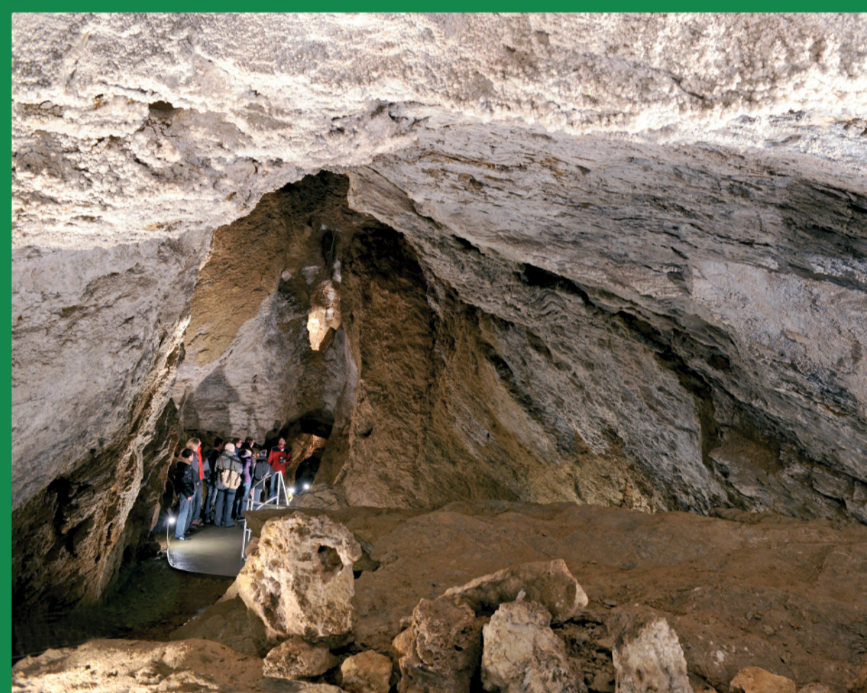
Největší prostorou Zbrašovských aragonitových jeskyní je Jurikův dóm.