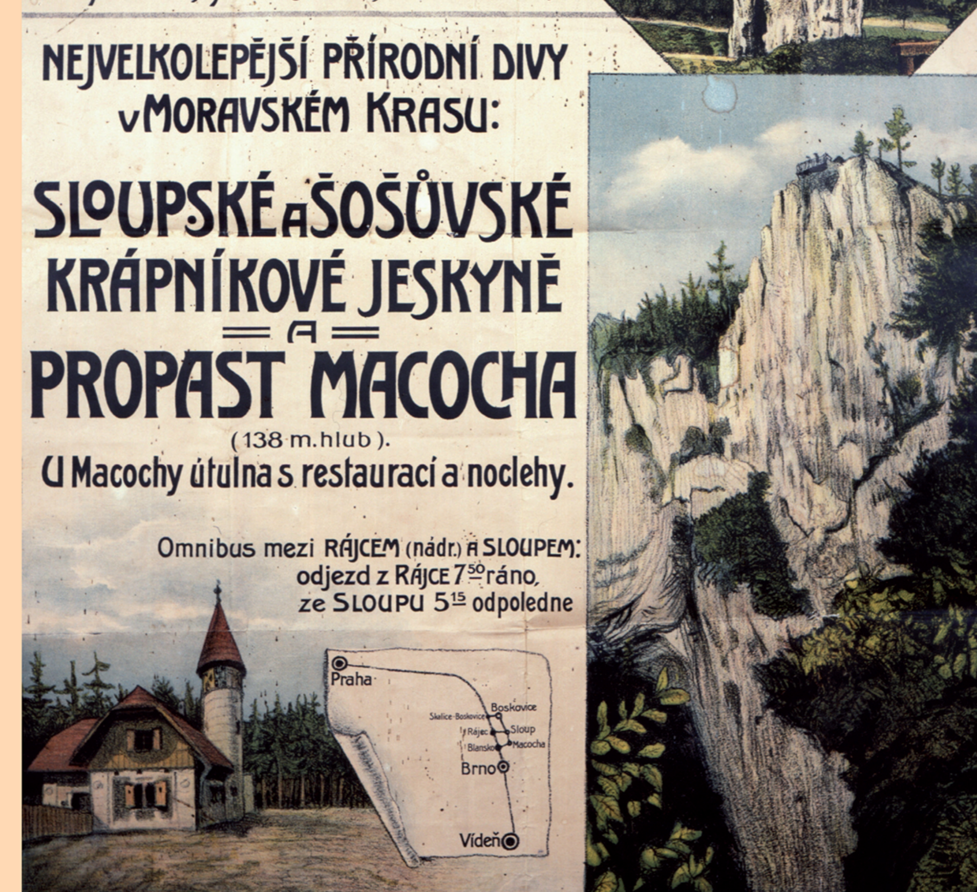
Plakát Klubu českých turistů z 1. poloviny 20. století Poster of the Czech Tourists Club from the first half of the 20 th century