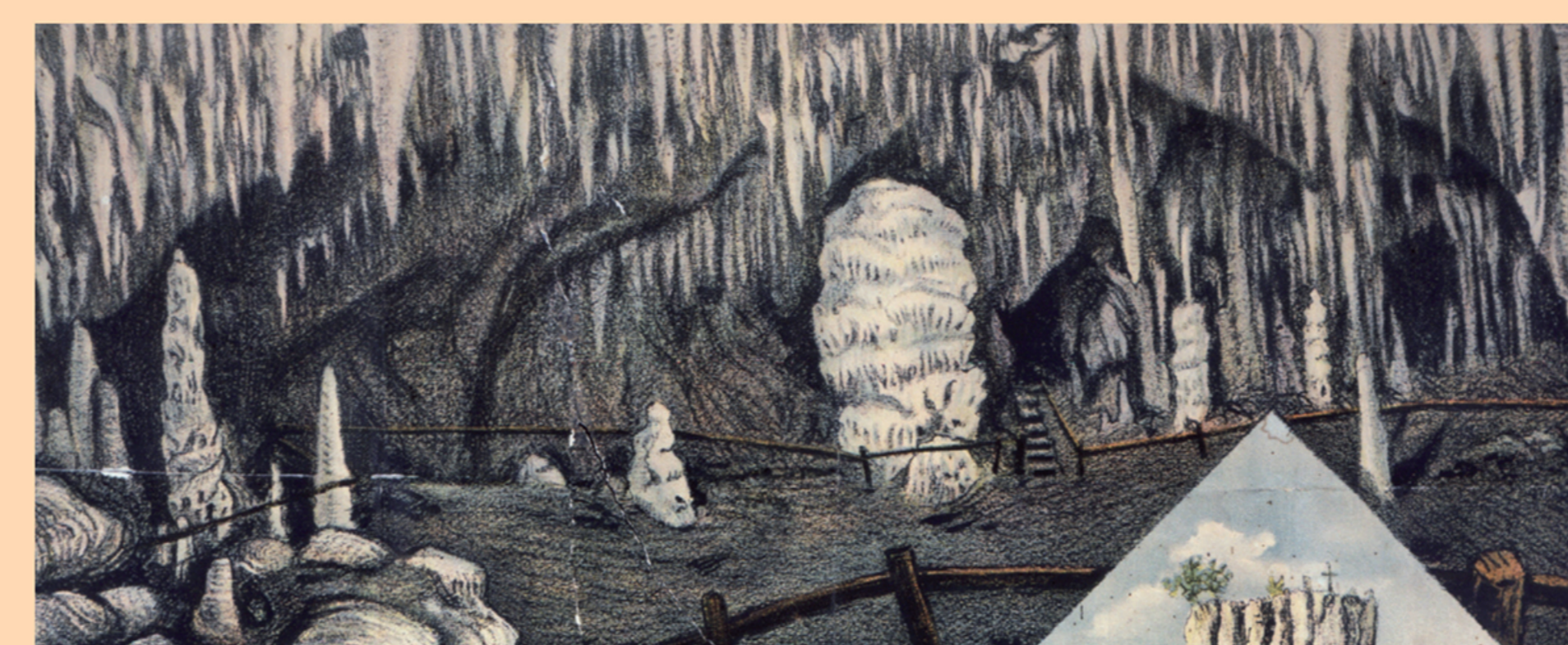
Odbory Klubu českých turistů v Boskovicih av Blansku.