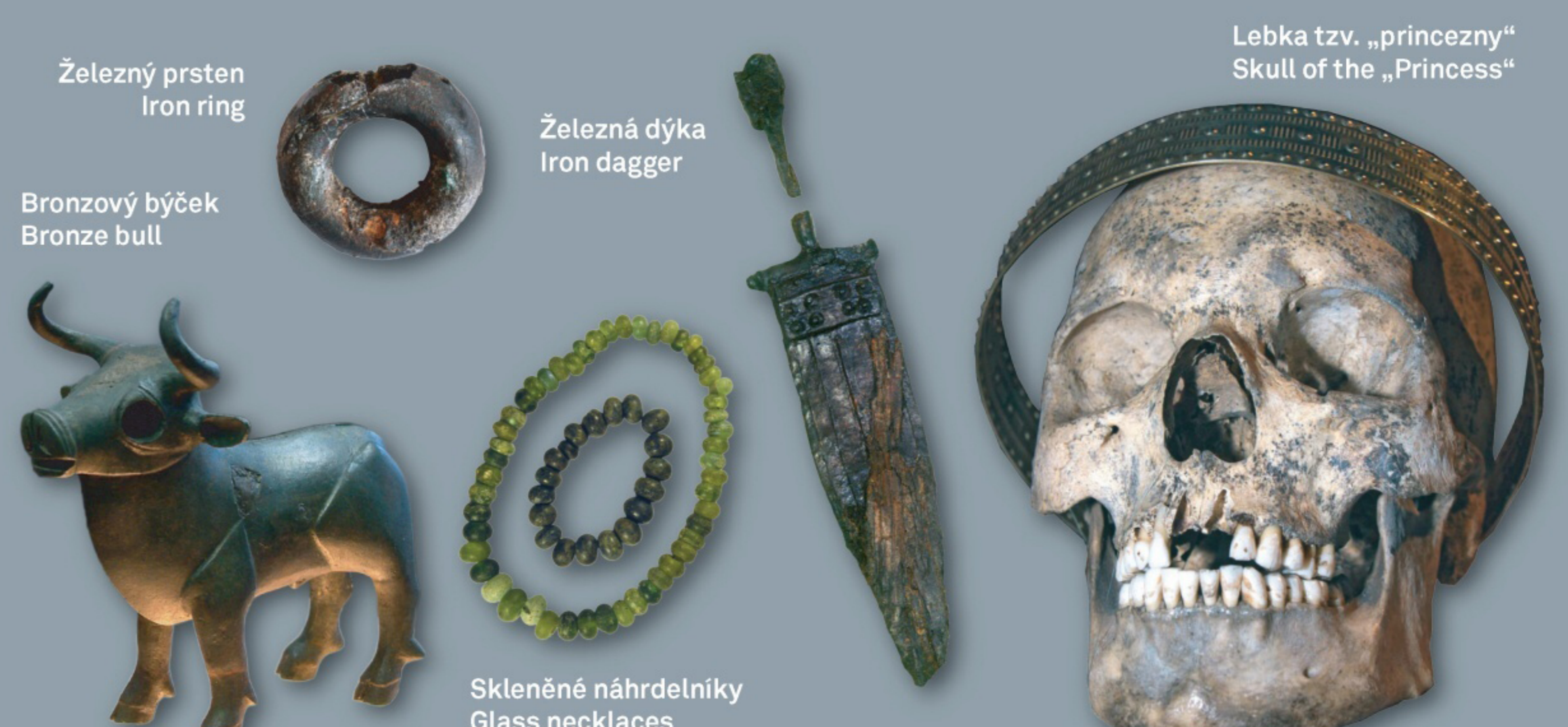
Železný prsten / Iron ring Železná dýka / Iron dagger Bronzový býček / Bronze bull Skleněné náhrdelníky / Glass necklaces Lebka tzv. „princezny“ / Skull of the „Princess“

TAJEMNÁ BÝČÍ SKÁLA / MYSTERIOUS BÝČÍ SKÁLA CAVE Nálezem evropského významu se stal soubor předmětů a lidských obětí ze starší doby železné – halštatu. Finding of European significance has become a set of objects with human sacrifices from the Iron Age - Hallstatt.