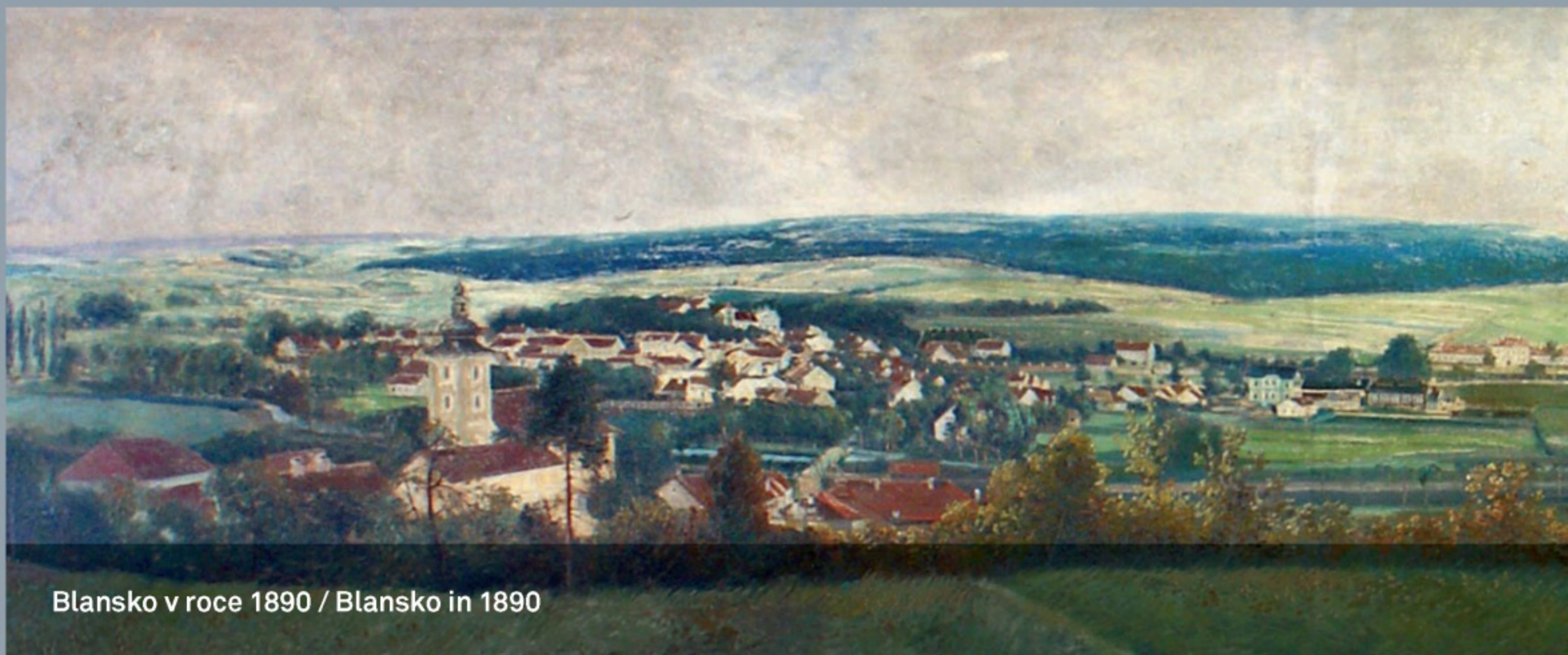
Blansko v roce 1890 / Blansko in 1890