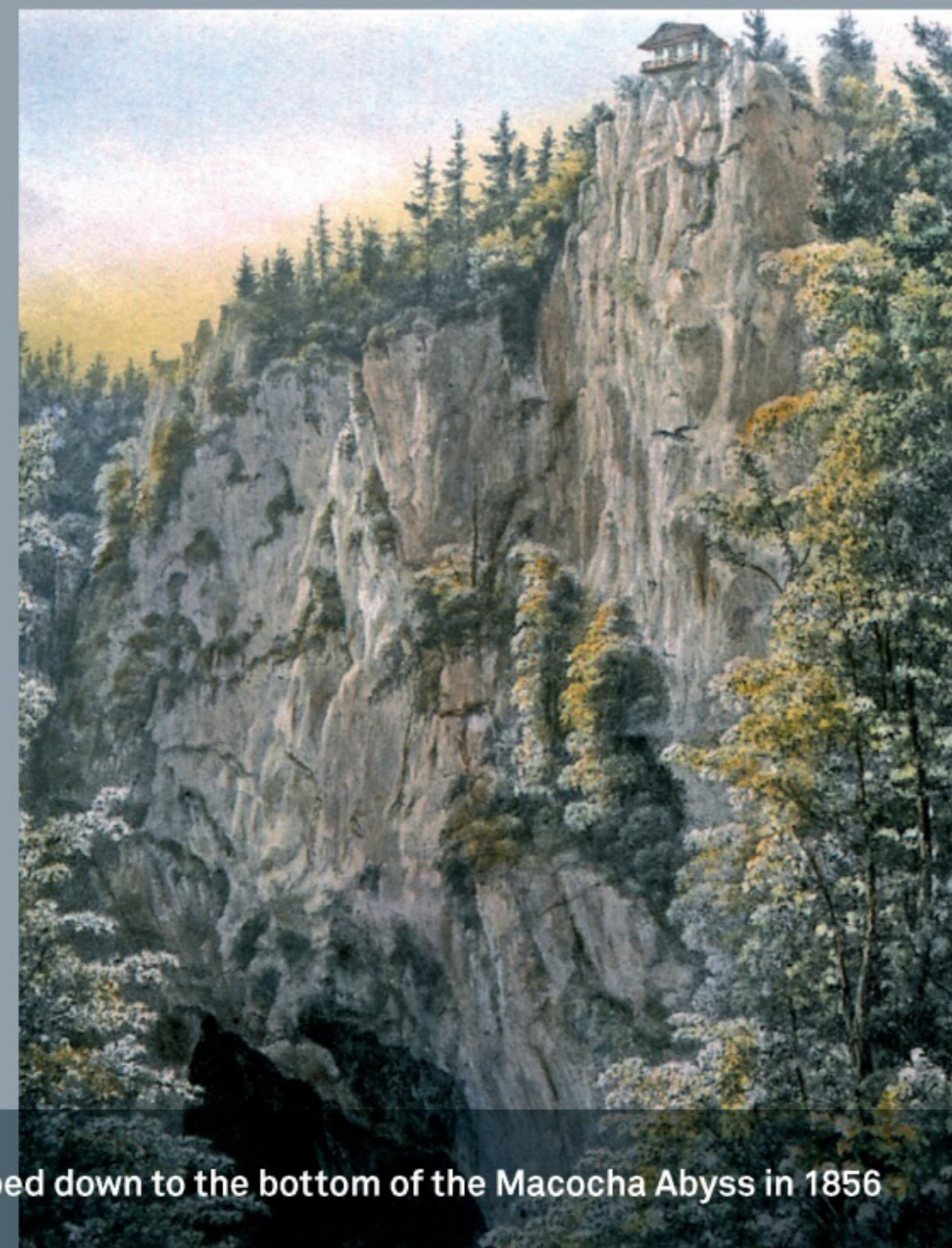
Propast Macocha / Macocha Abyss, Jacob Alt, 1855