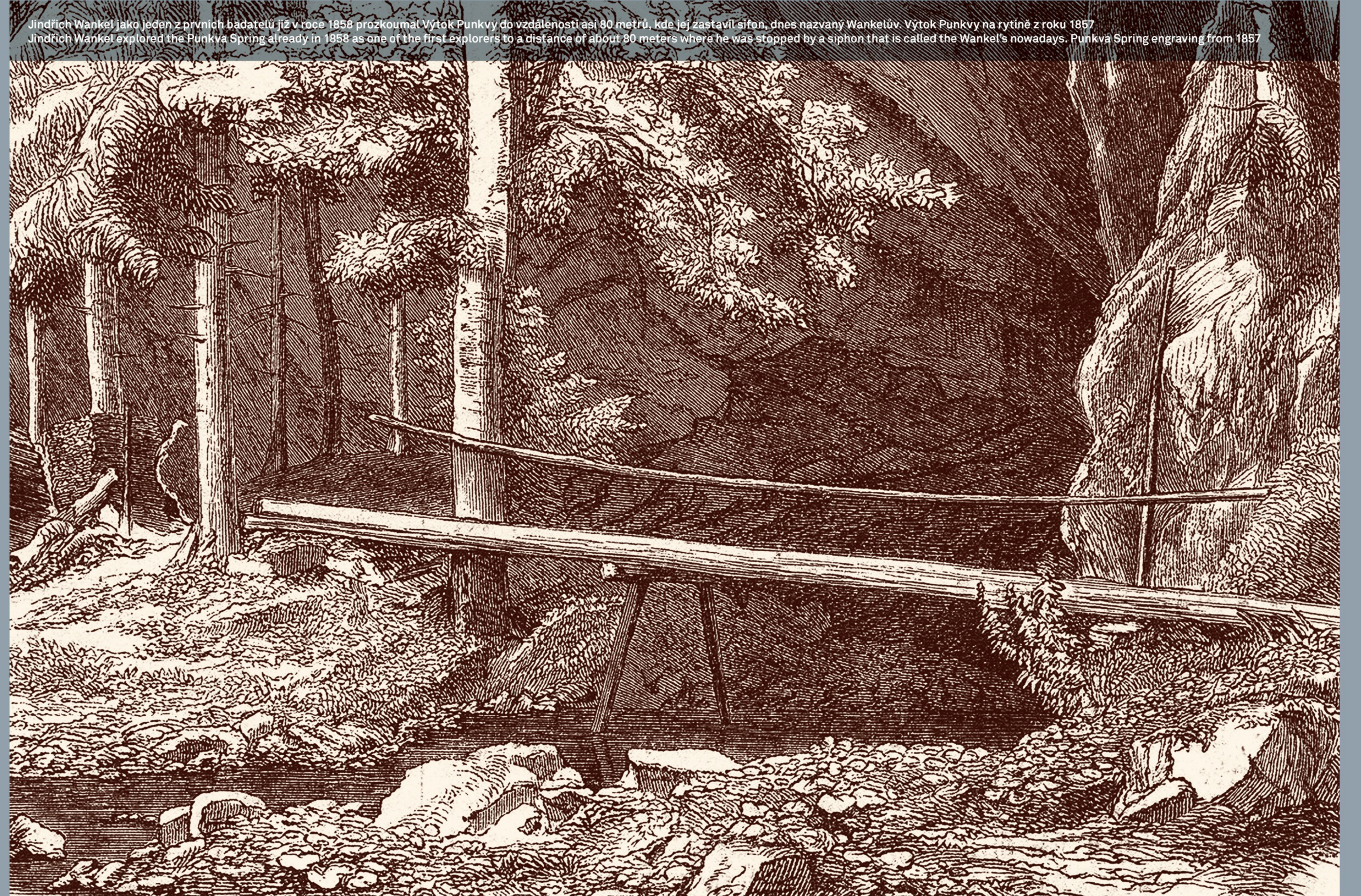
Jindřich Wankel jako jeden z prvních badatelů již v roce 1856 prozkoumal Výtok Punkvy do vzdálenosti asi 80 metrů, kde jej zastavil sifon, dnes nazvaný Wankelův. Výtok Punkvy na rytině z roku 1857. Jindřich Wankel explored the Punkva Spring already in 1856 as one of the first explorers to a distance of about 80 meters where he was stopped by a siphon that is called the Wankel's nowadays. Punkva Spring engraving from 1857

NÁLEZY ZE SLOUPSKÉ JESKYNĚ A VÝPUSTKU / FINDINGS OF THE SLOUP CAVE AND VYPUSTEK CAVE Mezi jeskyněmi, které Wankel prozkoumal, jsou výsoco hodnoceny nálezy ze Sloupské jeskyně a Výpustku. There are highly ranked findings from Sloup and Vypustek Cave among the caves, that were explored by Wankel.