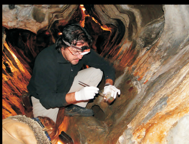
Technolog restaurování při testování pigmentů a pojiv.

Nejvíce diskuzí bylo kolem původu ústřední nástěnné malby, zvané dříve Kalvárie. Jedná se o Adoraci (Uctívání) Kříže. Tato malba je nejen nejvýznamnější historickou památkou jeskyně, ale v jeskyních Čech, Moravy a Slezska je objektem zcela výjimečným. U paty kříže klečí dvě modlící se postavy. Postava po Kristově pravici představuje zástupce církevní moci, po levici zástupce světské moci, donátora, zde zpodobněného s korunou. Oba vyjadřují společnou pokoru před Bohem.