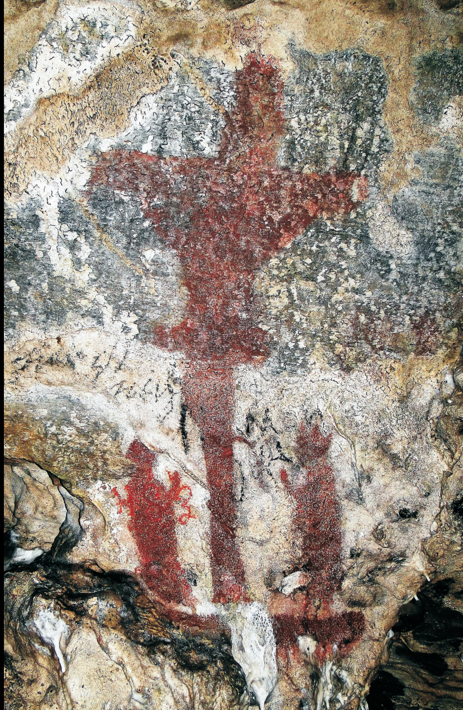
Malba Adorace Kříže před restaurováním (stav k r. 2009) a po restaurátorské obnově na podzim 2013.