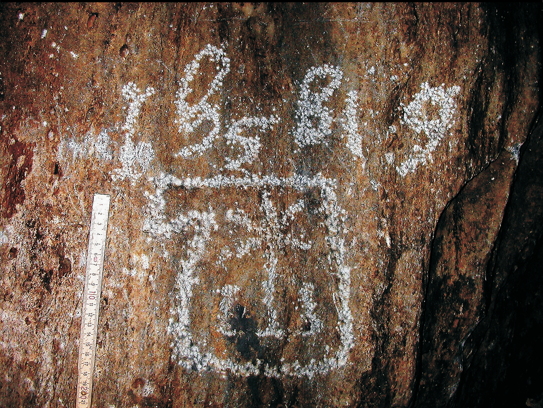
Nejstarší letopočtem datovaný epigraf v jeskyni (1519).