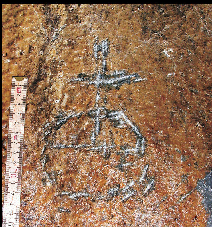
Vyobrazení říšského jablka v Dvojitě srdcové chodbě.

Malba, tehdy všeobecně srozumitelnou řečí symbolů, zřejmě oznamovala náhodným návštěvníkům jeskyně, kdo je v oblasti vlastníkem rudného bohatství. Křesťanská symbolika navíc plnila i funkci ochrannou, zvláště v nebezpečném prostředí dolů a podzemí.